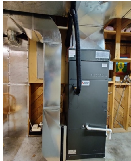
Figure 1 : Unité intérieure Zuba de Mitsubishi (42 000 BTU/h) à la verticale avec sortie simple

Voici les leçons tirées des cinq participants et des cinq unités utilisées pendant la saison froide 2020-2021.