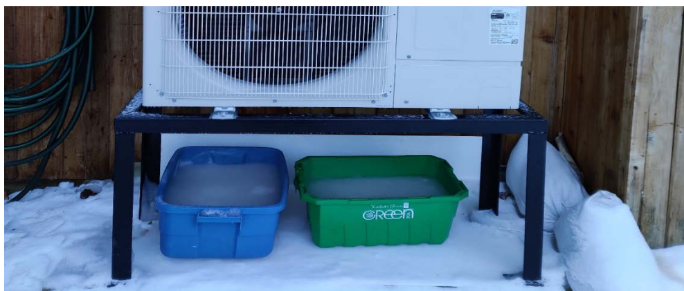
Figure 3 : Solution de gestion de l'eau du dégivrage sous l'unité extérieure Zuba (42 000 BTU/h) de Mitsubishi, avec bacs et sacs de sable posés sous l'unité et à côté.

Plusieurs propriétaires ont signalé que l'entretien en hiver était considérable, voire quotidien dans certains cas.