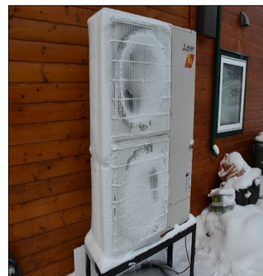
Figure 5 : Unité extérieure Mitsubishi (42 000 BTU/h) couverte de glace.